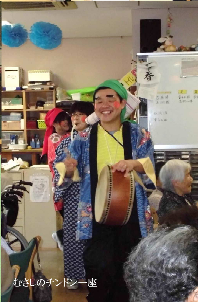
むさしのチンドン一座