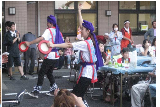
職員によるエイサー