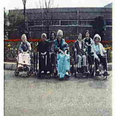
今日はまだ肌寒いな・・・。