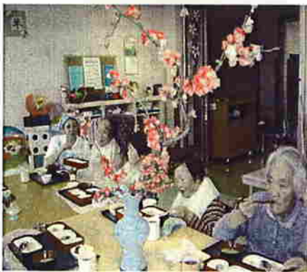
1Fのリハ室から川沿いの桜を眺め 食事をしています。