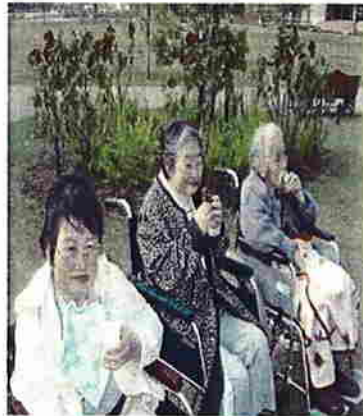
キラリ☆ふじみにて・・・ もぐもぐ、もぐり(^。^)