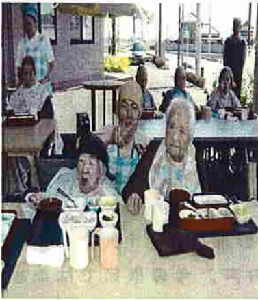
職員も楽しんでま〜す。