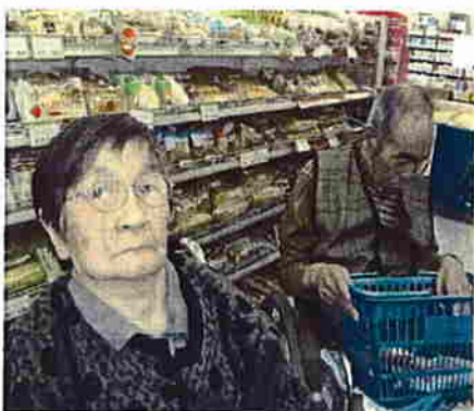
コンビニって何でもあるわね！