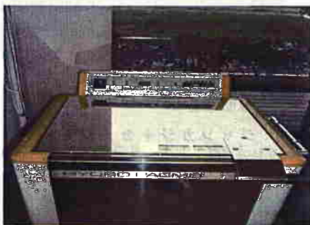
ホットパックを暖める機械

③各ユニット、居室に伺い訓練へのお誘いをします。「まだ、眠いわ・・・！」「今日はちょっと体調が・・・！」などなど予定はどんどんかわります。当日都合の悪い方もあれば、朝からエレベーターの前で「今か、今か！」と待ちわびている方もいらっしゃいます。大切なのは本人の意思！無理矢理訓練しても、うまくいきません。「やりたい時にやりたいことを」心がけ、のびのびゆっくり心も体も一緒に訓練するような感じます。時には居室付近で、理学療法士の先生と共にその場その場に応じた動作を見ながら訓練を行うこともあります。