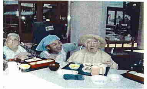
外で食事もたまにはいいなあ！