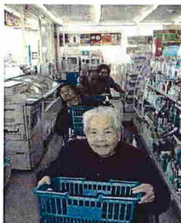
さてこれから選ぶわよ！！