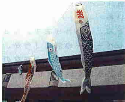
青空に優雅に舞ってる僕達です！