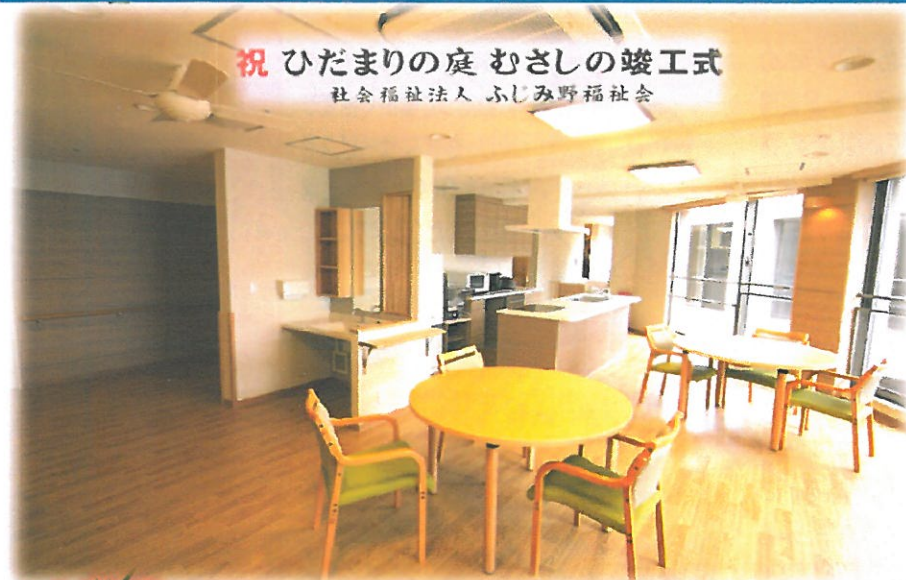
祝 ひだまりの庭 むさしの竣工式 社会福祉法人 ふじみ野福祉会

平成24年9月16日、法人・施設に関する多くの方にお集まりいただき竣工式を開催し、10月1日に施設を開業しました。近くにお越しの際は、是非お立ち下さい。